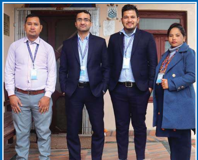
कोहलपुर शाखा कार्यालयका कर्मचारीहरू