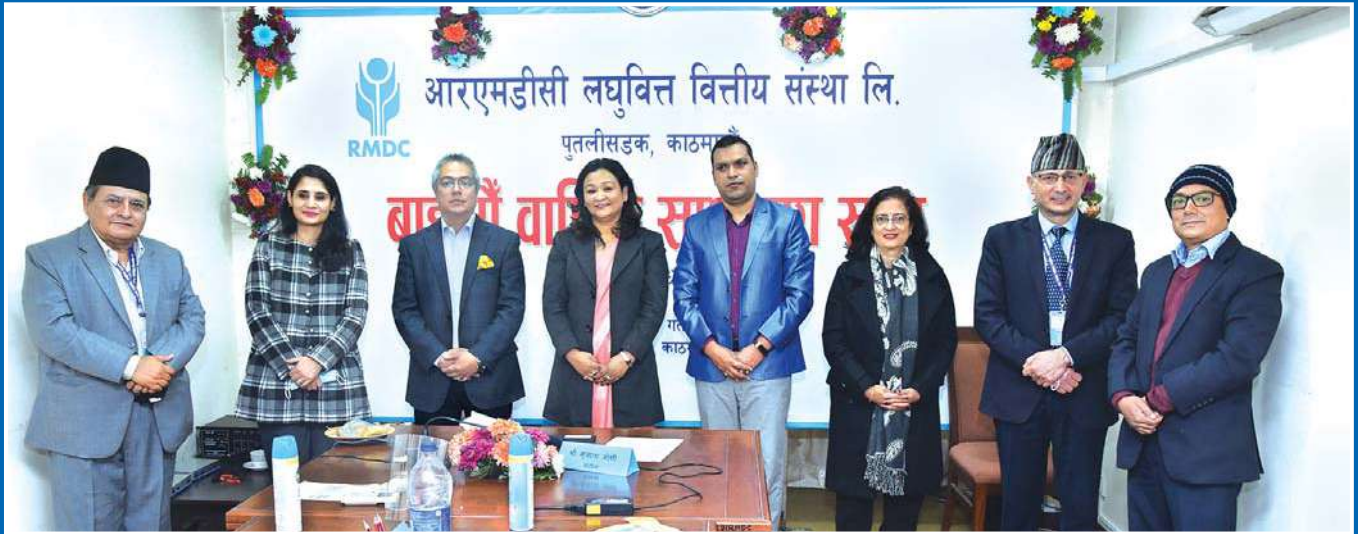
२२औं वार्षिक साधारण सभामा संस्थाका अध्यक्ष सहित संचालकहरू र पदाधिकारीहरू