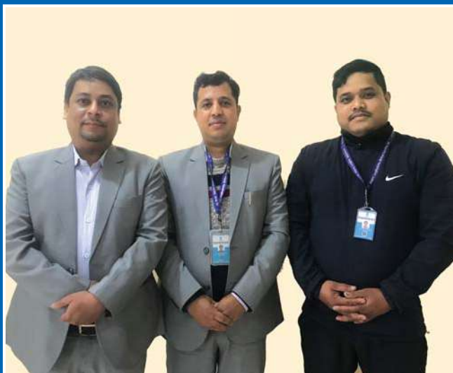
इटहरी शाखा कार्यालयका कर्मचारीहरू