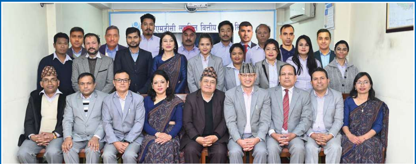
प्रमुख कार्यकारी अधिकृत सहित केन्द्रीय कार्यालयका कर्मचारीहरू